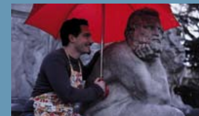
Io amo i Beni Culturali di Scomunicati